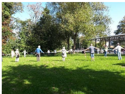
Verbinding op 1,5 meter

In de Vredesweek van 19-27 september hebben we ondanks de corona beperkingen samen met de diverse partners in de stad een mooi Vredesprogramma neergezet met als thema: Vrede verbindt verschillen.